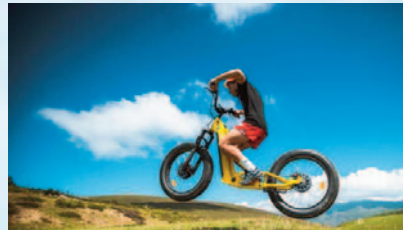
Trottinette de descente