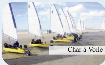
Char à Voile