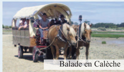
Balade en Calèche

Face à Fort Boyard, entre Ré et Oléron, l'île d'Aix est un petit croissant de terre de 3 km de long sur 700 m de large, qui est classée sur la liste des sites naturels remarquables. Véritable microcosme, largement ensoleillée où tous les paysages sont représentés, elle ne se découvre qu'à pied ou à bicyclette, la circulation automobile ayant été volontairement limitée.