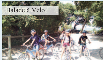
Balade à Vélo