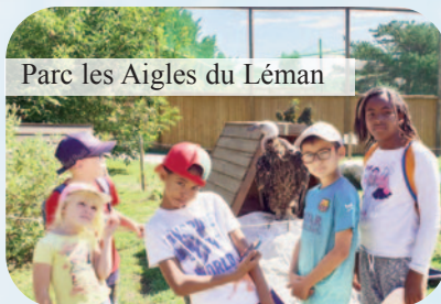
Parc les Aigles du Léman