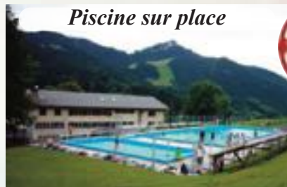
Piscine sur place